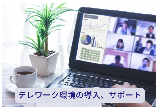
テレワーク環境の導入、サポート