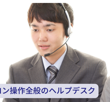
パソコン操作全般のヘルプデスク